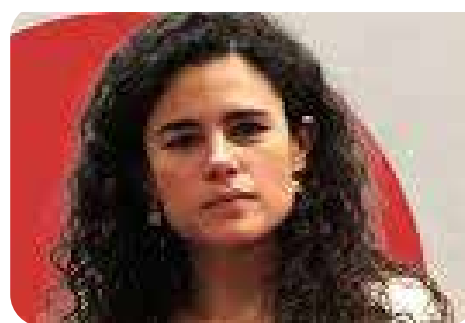
Luisa María Alcalde Luján