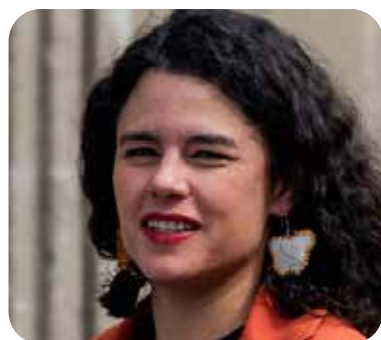
Luisa María Alcalde