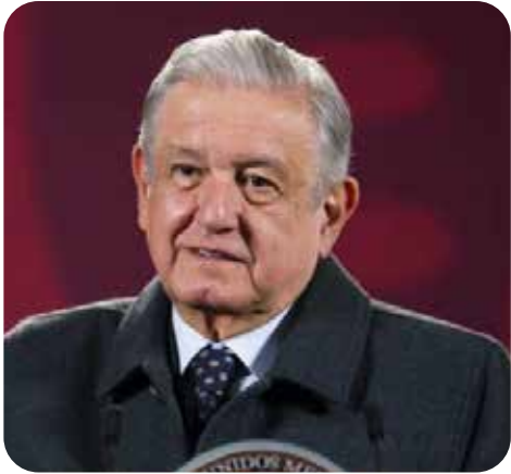
Andrés Manuel López Obrador