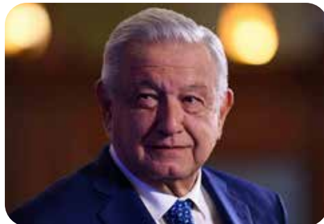
Andrés Manuel López Obrador