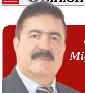
Columna de Miguel Ángel Vega C.